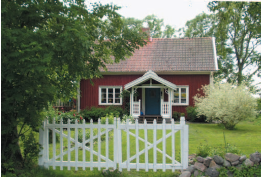
Unser »grünes Paradies« Kämpesgården Sommer 2004