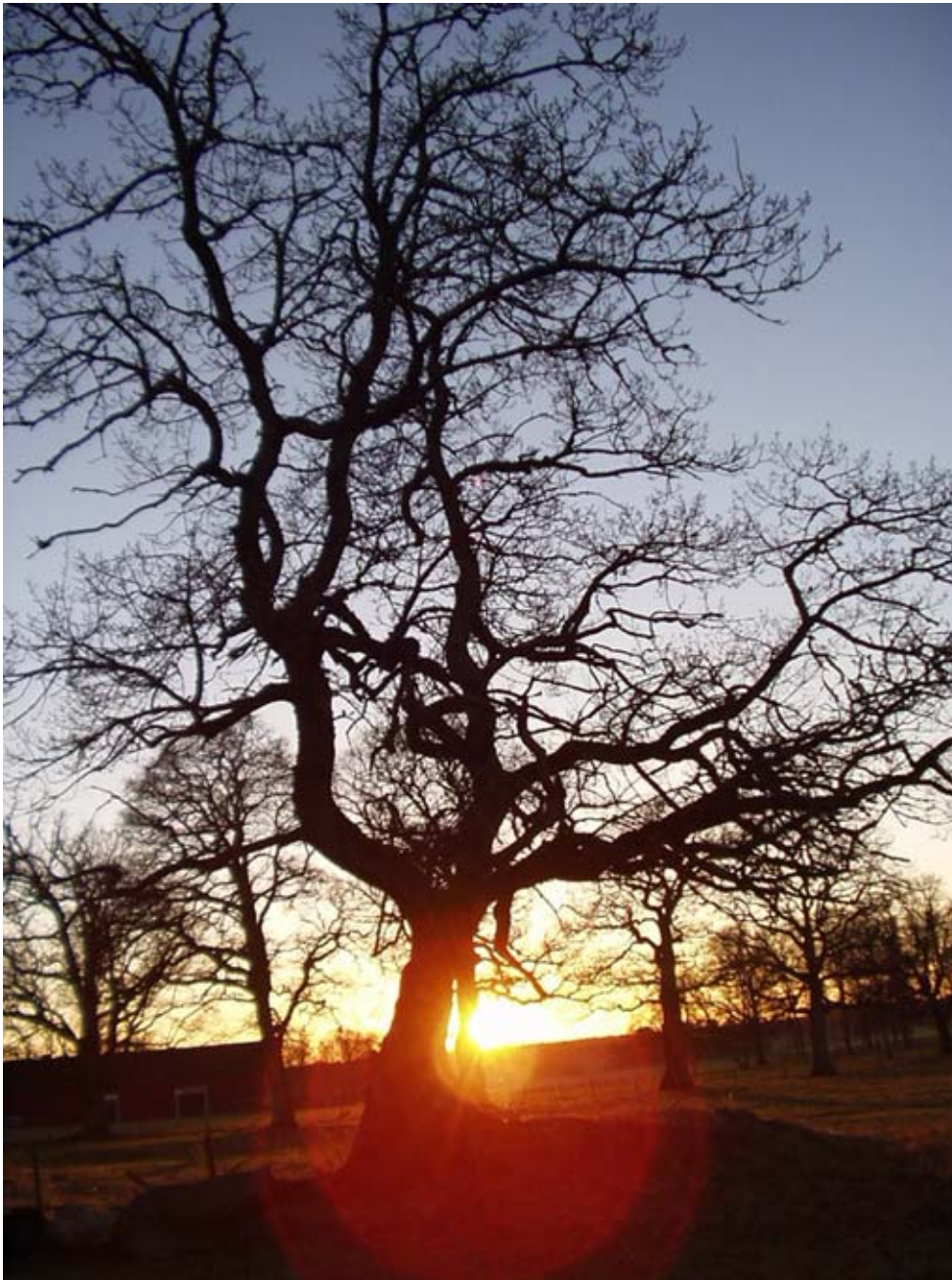
»Levene äng« Herbst 2003